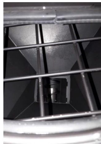
Silo sin pellet y extremo del sinfin largo