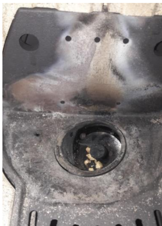
Sinfin corto al retirar el brasero

Hay que confirmar que los 2 tornillos sinfin funcionan correctamente. Esperar a que la estufa esté fría o a que alcance 50°C en la temperatura de humos. Ir al teclado de la estufa y mantener presionado el botón con el logo del sinfin. Retirar el brasero y comprobar si el sinfin gira en sentido de las agujas del reloj. Vaciar el silo de pellet y confirmar que si el sinfin largo gira en el sentido contrario de las agujas del reloj.