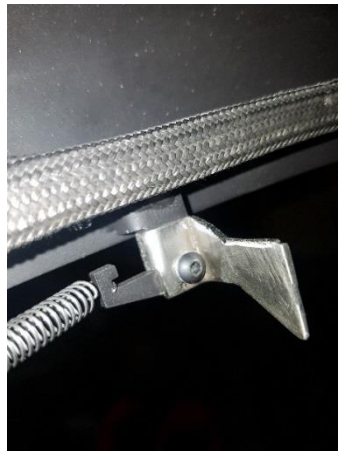
Nuevo cierre una vez instalado

Desatornillar la placa termica de debajo de la cámara de combustión. Montar el nuevo sensor como se indica en la foto. Conectar los cables cuidadosamente. Los cables tienen que conectarse como se indica en la foto.