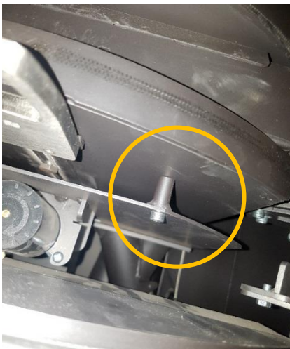
Tornillos que sujetan la placa térmica.

Desatornillar la placa termica de debajo de la cámara de combustión. Montar el nuevo sensor como se indica en la foto. Conectar los cables cuidadosamente. Los cables tienen que conectarse como se indica en la foto.