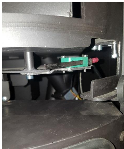
Nuevo sensor ya instalado.