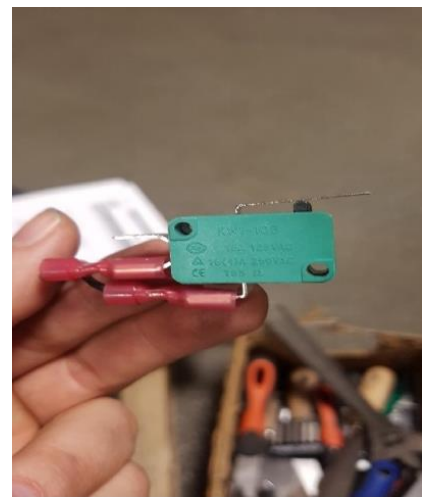
Conexión de los cables al sensor

Una vez que el sensor esta intalado y conectdo el problema quedará resuelto.