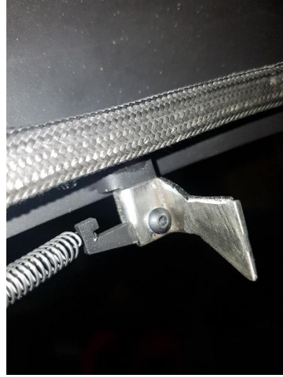
Nuevo enganche ya instalado