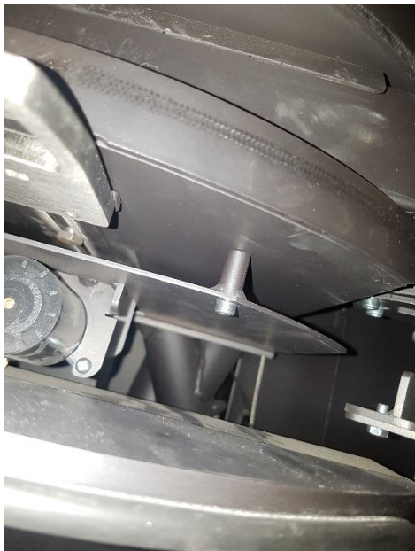
Placa térmica sin sensor

Para instalar el nuevo sensor utilice el tornillo de la placa térmica. El sensor tiene que quedar instalado como se indica en la foto, para que el nuevo cierre siempre toque el sensor al cerrar la puerta.