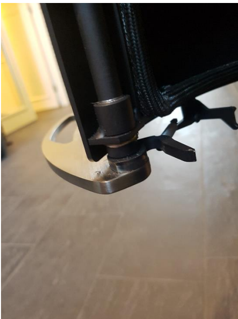
Enganche de la puerta