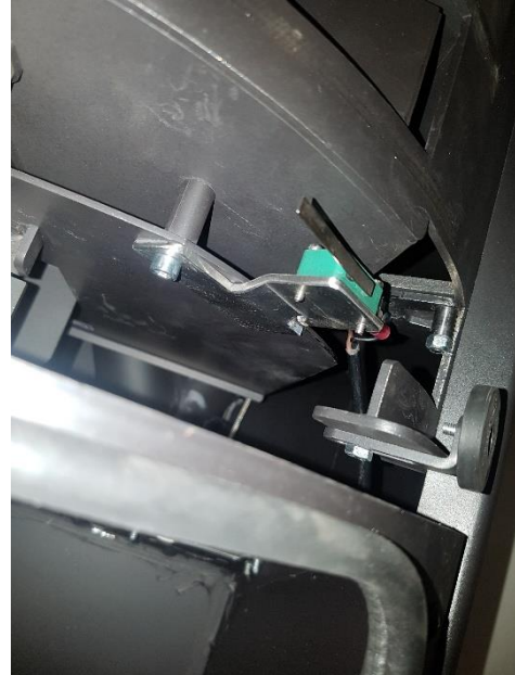
Nuevo sensor instalado en la placa térmica