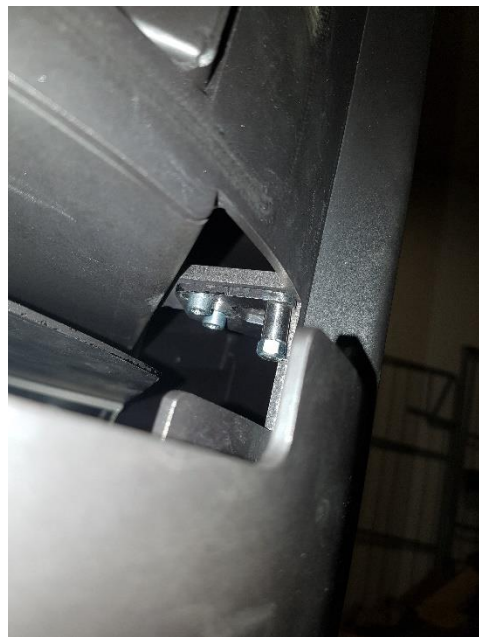
Soporte de cierre en la estufa.

Solución: El primer paso es ajustar la puerta y asegurarse que cierra correctamente. Hay que comprobar que el enganche de la Puerta entra perfectamente en el soporte de cierre y presiona el sensor de la puerta cuando la Puerta está cerrada.