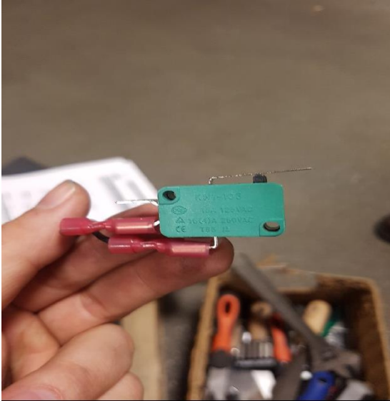
Conexión de los cables

Conectar los 2 cables rojos en el nuevo sensor como se indica en la foto.