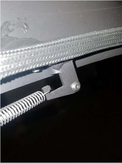
User el tornillo de la estufa

Instale el nuevo enganche de la puerta usando el tornillo la estufa.