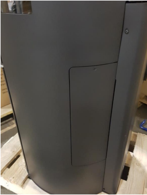
Plancha metálica para acceder al sensor