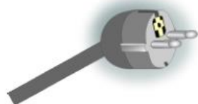
To runde stifter og to jordclips.

Tyskland, Østrig, Holland, Sverige, Norge, Finland, Portugal, Spanien, Frankrig, Belgien og Østeuropa