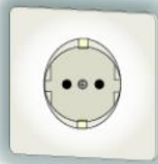
To runde stifter og to jordclips.