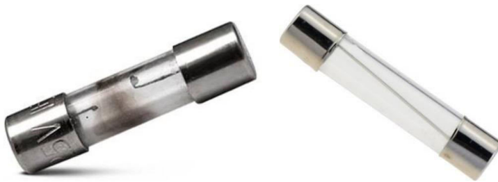
Sprunget sikring vs. funktionel sikring